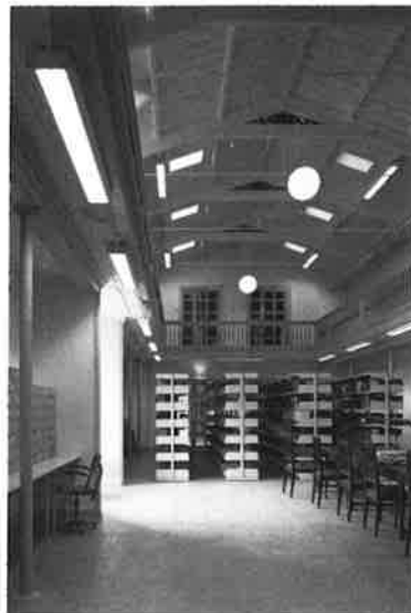
Het in eigen beheer door de Dienst Bouw en Huisvesting van de Universiteit van Amsterdam verbouwde interieur van de Artis-bibliotheek.

architectuur van Salm en de kwaliteiten van deze ruimte.