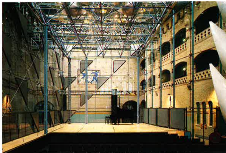
Interieur van de geheel transparante repetitiezaal van het Nederlands Philharmonisch Orkest die ook gebruikt wordt voor uitvoeringen van kamermuziek.

van de ongeschikte zaal van de Beurs heeft de ontwerpers zó in haar greep gehad, dat het resultaat van hun inspanningen onder andere omstandigheden niet perfecter had kunnen zijn.