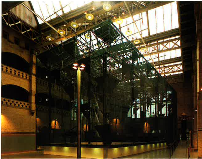
De AGA-zaal, een door architect Pieter Zaenen in samenwerking met constructeur Mick Eekhout geconstrueerde glazen doos in de voormalige Graanbeurs in de Beurs van Berlage. Het beursgebouw wordt volledig in tact gelaten.