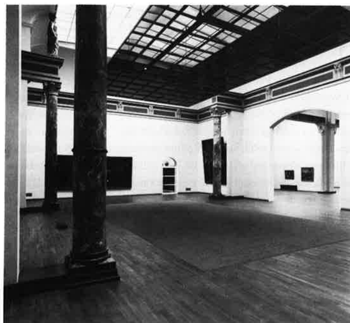
De Nachtwachtzaal van het Rijksmuseum na de ver- bouwing. De schilderijen worden van bovenaf aange- licht; een velum van getinte glazen panelen zet de toe- schouwers in de schaduw.

Omdat de beurszaal van Berlage evenals trouwens de voormalige Effectenbeurszaal, voor muziek ongeschikt is wegens geluidsoverlast van buiten en vanwege de enorme nagalmtijd, werd er een doosvor- mige ruimte in gebouwd, die in staal en glas is uitgevoerd. De oplos- sing is op zich niet origineel: er zijn wel meer dozen in monumentale ruimten neergezet om dat monument functioneel te laten voortbe- staan. De Oosterkerk in Amsterdam en de Buurkerk in Utrecht bie- den daarvan een voorbeeld. De zaal zoveel mogelijk van glas te willen maken om in de nieuwe doos de ruimte van Berlage optimaal aanwe- zig te laten zijn is een hachelijke onderneming, die echter volledig is geslaagd. Er is nu een paradoxale situatie ontstaan: de architectuur