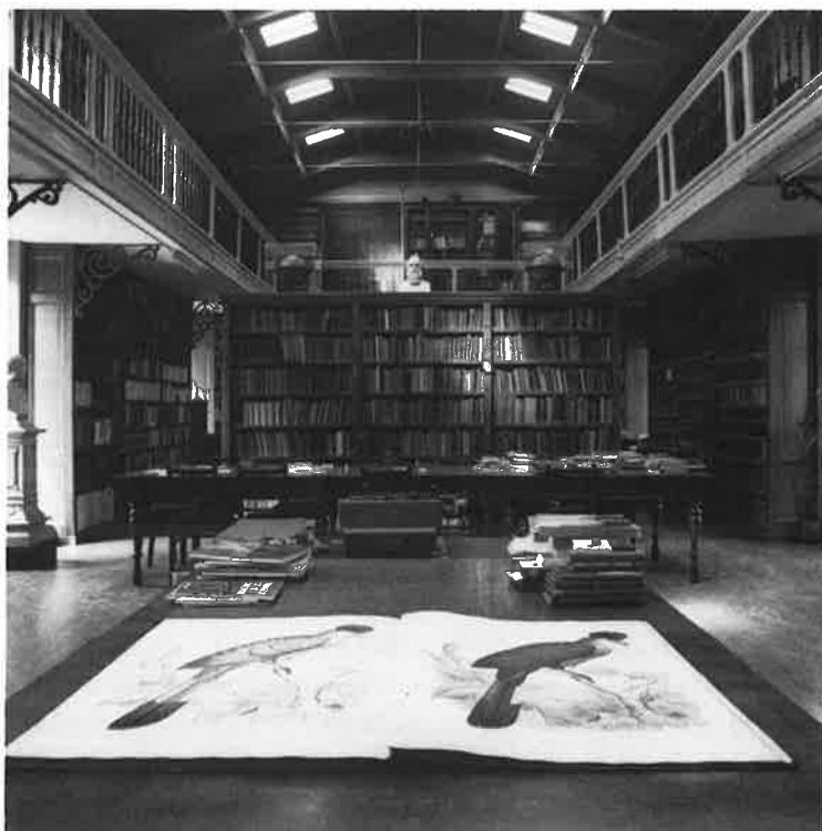
Het oorspronkelijk interieur van de Artis-bibliotheek van architect Salm voor de laatste verbouwing.

Bij elk van de handelingen gaat het om een kleinigheid, maar de som van al die handelingen heeft het interieur zwaar verminkt. De ziel is eruit; er is gewerkt zonder enig respect voor of affiniteit met de