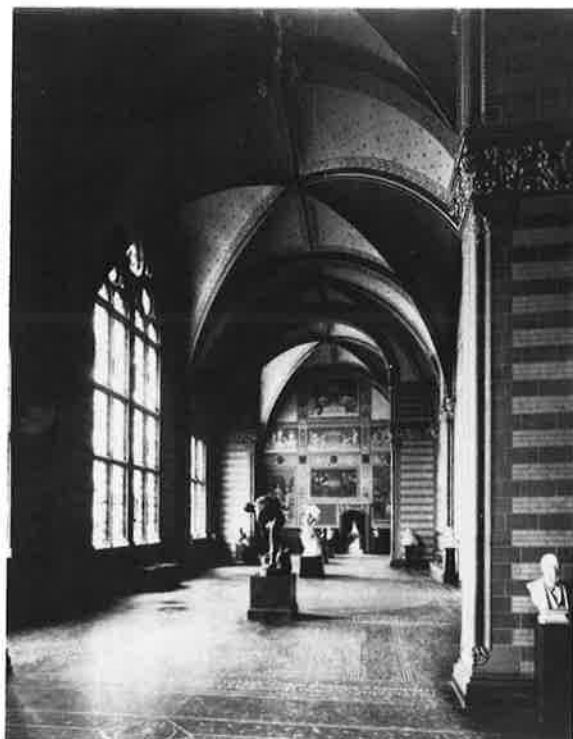
De voorhal van het Rijksmuseum zoals deze door Cuypers werd ontworpen met een van de meest opmerkelijke profane decoratieprogramma's die in de afgelopen tweehonderd jaar zijn gemaakt. Situatie ± 1890.

Het gewitte interieur van de twintigste eeuw ontstond vanuit de opvatting dat kunstwerken uit de collectie ten opzichte van de omgeving geïsoleerd dienden te worden, teneinde ze ongestoord te kun-