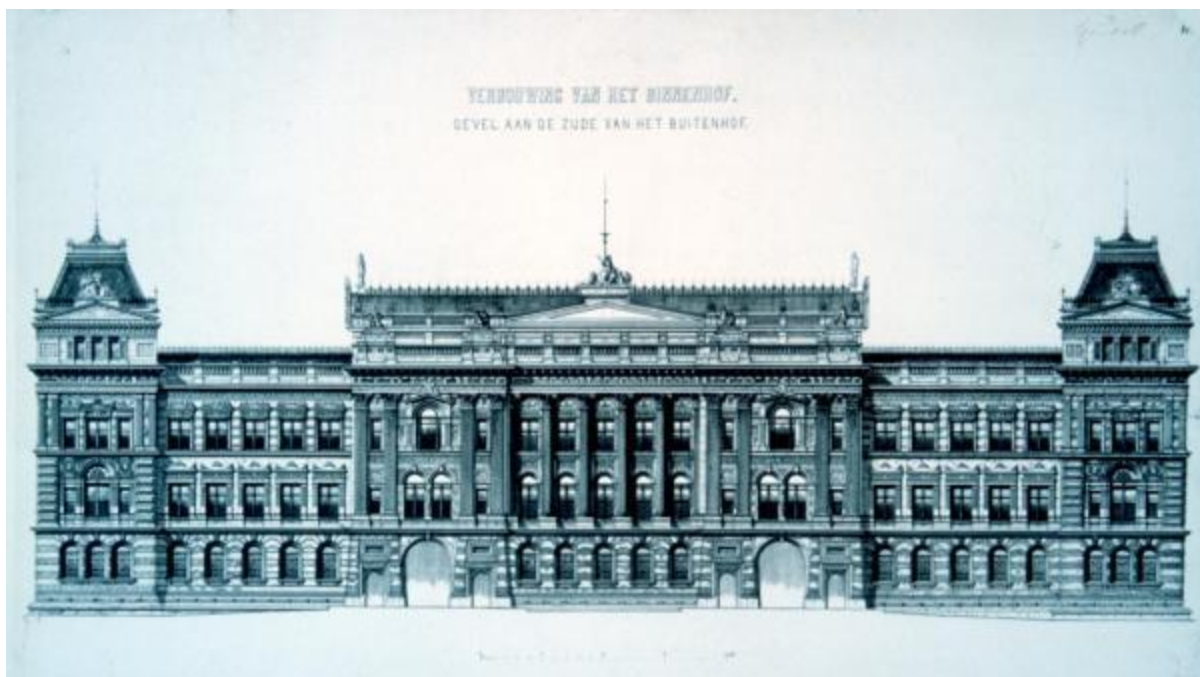
Binnenhof, ontwerp zuidgevel (Buitenhofzijde) Eugen Gugel 1879.

De inspanningen van de organisatoren van de prijsvraag 1864 voor een nieuw Parlement leidden dus tot niets.