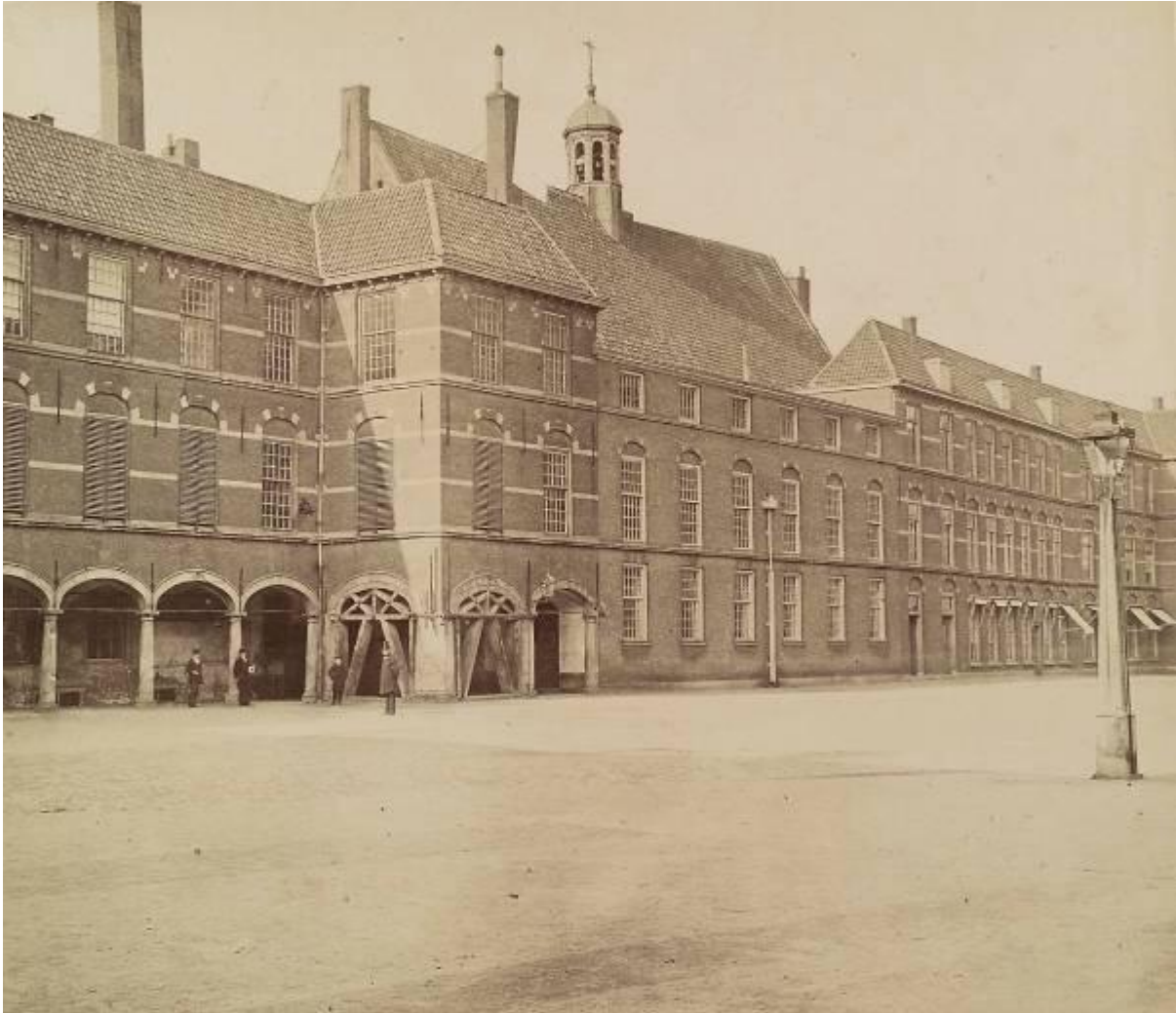
Binnenhof westzijde, 1879.

De actuele perikelen rond de restauratie en modernisering van het Binnenhof staan niet op zichzelf. Zo'n ensemble met een herkomst uit de late middeleeuwen is telkens opnieuw verbouwd en aangepast. Ook 150 jaar geleden werd een poging tot modernisering van het gebouwencomplex ondernomen. In dit artikel passeren twee plannen de revue: een prijsvraagplan en een poging tot antwoord op de impasse die door die prijsvraag ontstond. De gang van zaken rond die plannen vormt een representatief moment in de geschiedenis van het voortdurende werk aan het Binnenhof.