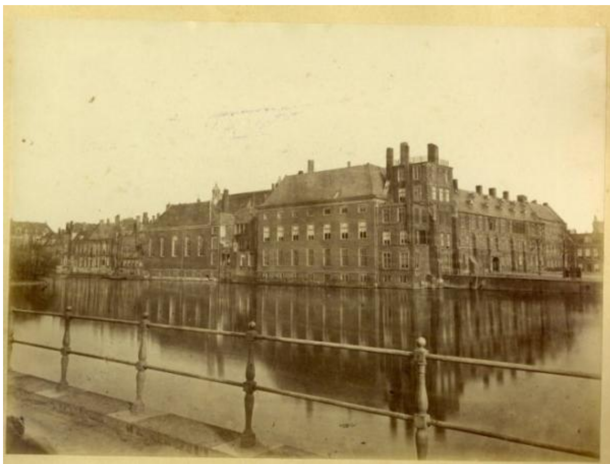
Binnenhof, zuidwestzijde 1879. Op de hoek de zogenaamde 'Mauritstoren', waarvan de sloop was voorzien. Aan de Hofvijver de vleugel met de grafelijke kapel (vijf vensters, schilddak) die voor plan Lange zou wijken. Rechts de vleugel aan het Buitenhof die voor plan Gugel zou worden gesloopt.

De tekeningen zijn hier verbonden met details uit de archieven van de afdelingen Onderwijs, Waterstaat en Kunsten en Wetenschappen van Binnenlandse Zaken, uit de archieven van Vosmaer, Fock, Waterstaat Handel en Nijverheid, het College van Rijksadviseurs, de Polytechnische School, de verzameling Thorbecke en de afdeling Landsgebouwen.